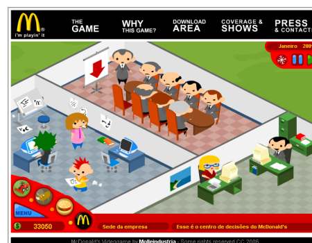
Figura 3: Screenshot do McDonald's Videogame

Jogo criado pela Molleindustria em 2006. Trata-se de um gerenciamento de lanchonete (Figura 3) entretanto revelando os bastidores do processo de produção dos sanduíches. Tem como inspiração os filmes Fast Food Nation de Eric Schlosser e Super Size Me de Morgan Spurlock. A Molleindustria produz pequenas experiências interativas, gratuitas para criar reflexões sociais. No caso deste jogo a produtora deseja criar uma reflexão sobre o processo produtivo de uma grande rede de fast foods e a consequência na saúde dos consumidores. Pode ser feito download gratuito para as versões Windows e Mac.