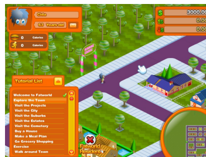
Figura 2: Screenshot do Fat World

Fat World foi criado em 2008 pela empresa Persuasive Games. É um simulador sobre políticas nutricionais (Figura 2). Viva em um mundo saudável, magro ou gordo? Viva ou morra? O jogador decide a alimentação da população e verifica o resultado nos próximos cinco, dez ou cinquenta anos. Pode ser feito download gratuito para as versões Windows e Mac.