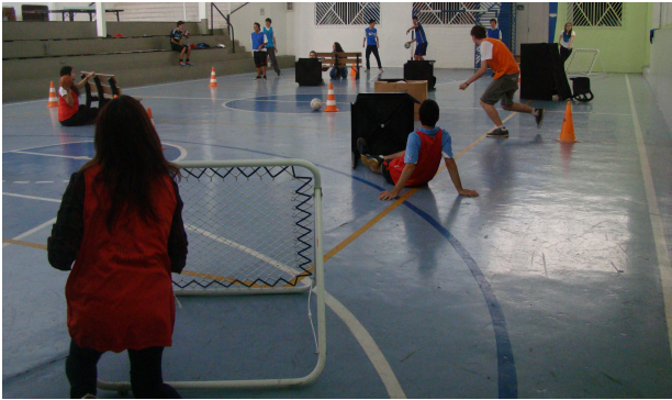
Figura 3: “Atualizando” Jogos Digitais no Ensino Médio

Além da concretização dos projetos por meio de jogos baseados nas experiências virtuais, pode-se perceber o engajamento e envolvimento dos alunos bem como a necessidade de planejamento claro e objetivo por parte dos docentes envolvidos, atentando para a constante e cada vez maior influência das mídias na vida cotidiana da comunidade escolar, à potencialização de aprendizagem de habilidades, estratégias e atitudes cooperativas envolvidas nos jogos e o respeito às características e realidades locais, buscando sempre estimular possibilidades criativas para solução de problemas desde que possíveis de serem realizadas